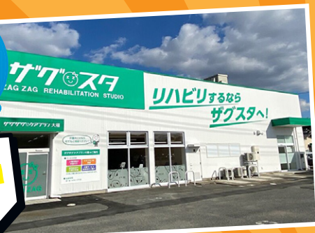
※写真はザグスタ大福です。