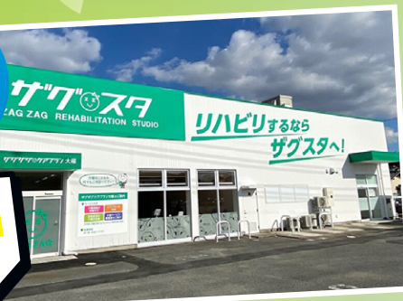
※写真はザグスタ大福です。